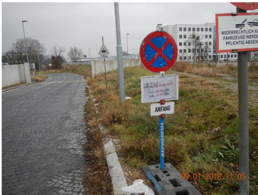
Abbildung 17: Provisorische Verkehrszeichen in dauerhafter Verwendung

7.2.7 Bei einer Hafeneinfahrt war von einer im Hafen tätigen Firma ein provisorisches Verkehrszeichen aufgestellt worden (s. Abb. 17). Das Verkehrszeichen Halten und Parken verboten trug auf einem Papierzettel hinter einer Klarsichtfolie die Aufschrift Gilt ab 29. Mai 2017 von 0.00 Uhr bis 24.00 Uhr . Das Verkehrszeichen war bei der Begehung durch die Prüfer des Stadtrechnungshofes Wien am 9. Jänner 2018 immer noch aufgestellt. Aufgrund des langen Zeitraumes von mehr als sieben Monaten lag eine dauerhafte und nicht mehr nur vorübergehende Verwendung des Verkehrszeichens vor.