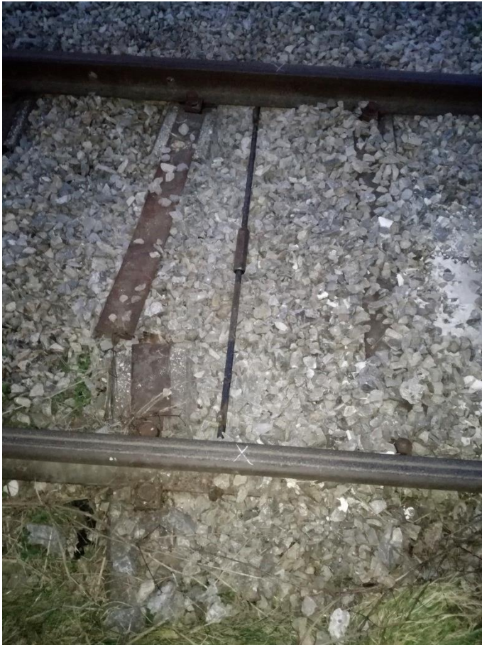
Abbildung 12: Provisorische Sicherungsmaßnahme zur Aufrechterhaltung der Spurweite