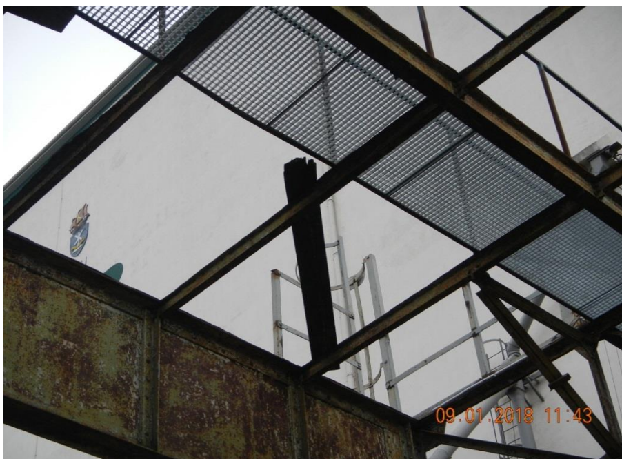
Abbildung 7: Ungesicherter Holzpfosten an einem Verladeturm

4.2.3 Auf dem Verladeturm lagen an mehreren Stellen ungesicherte Holzpfosten. Die Abb. 7 zeigt hierfür ein Beispiel.