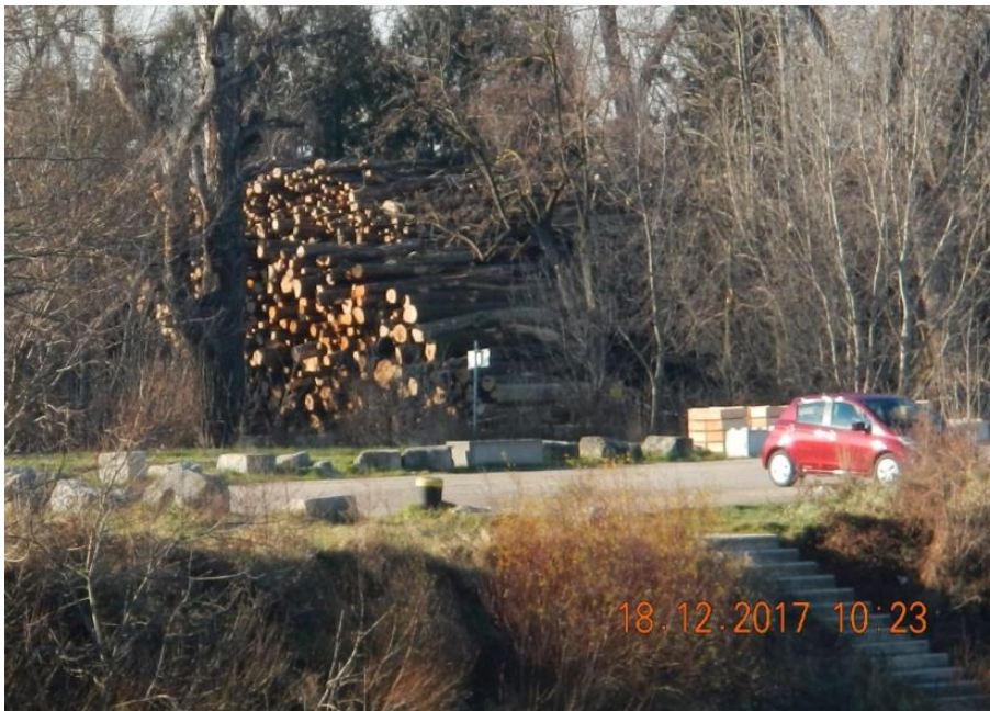
Abbildung 21: Holzlagerplatz nahe einem öffentlichen Parkplatz

7.4.2 Im Nahbereich des Parkplatzes befand sich am Hafengelände ein Holzlagerplatz einer Firma, zu deren Aufgabengebieten u.a. die Ernte und der Verkauf von Holz zählen (s. Abb. 21).