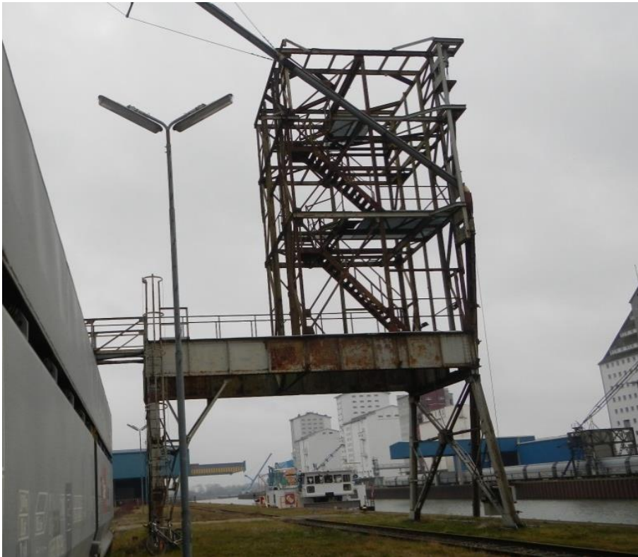
Abbildung 5: Verladeturm an der nördlichen Kaikante