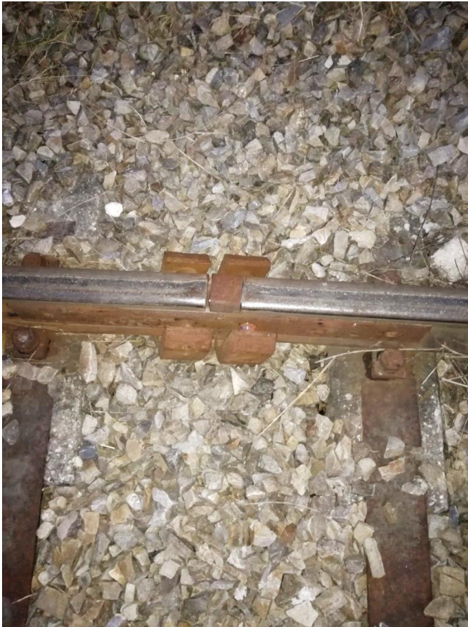
Abbildung 13: Provisorische Sicherungsmaßnahme zur Abstandsverminderung beim Schienenstoß