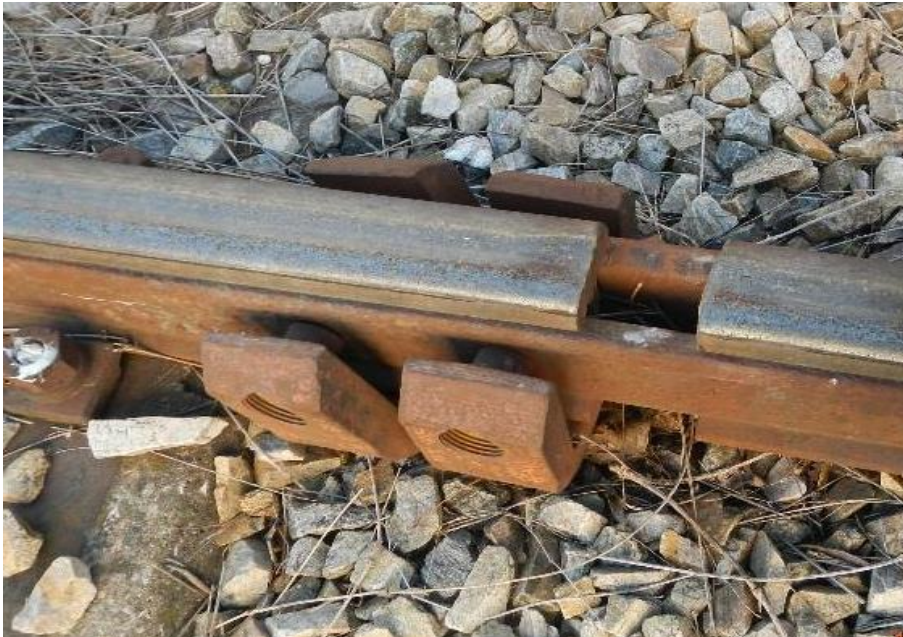
Abbildung 10: Nicht gesicherter Schienenstoß