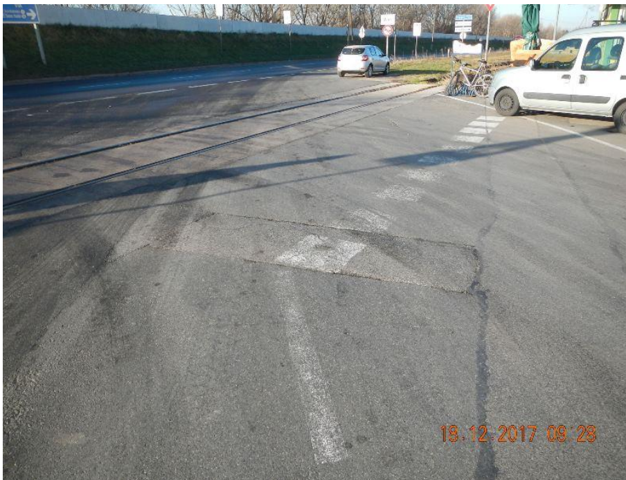
Abbildung 15: Verblasste Ordnungslinie vor einer Eisenbahnkreuzung

7.2.2 Anders verhielt es sich mit den Bodenmarkierungen und Straßenverkehrszeichen. Diese waren z.T. bereits verblasst bzw. undeutlich, wie die Abb. 15 und Abb. 16 zeigen.