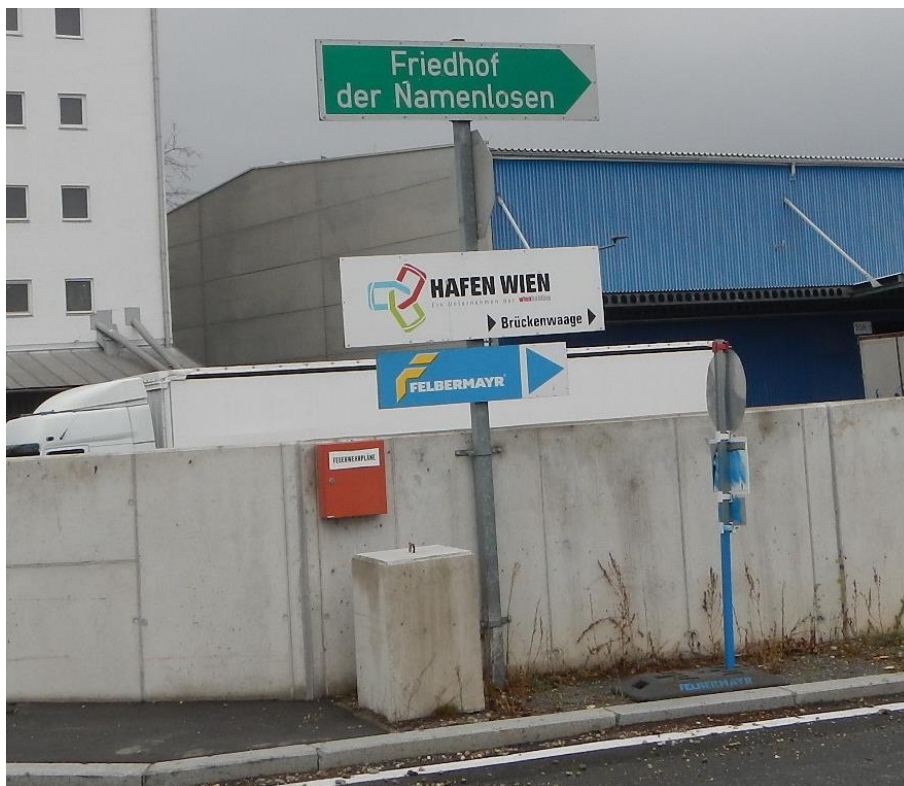
Abbildung 18: Hinweiszeichen bei einer Hafeneinfahrt

7.3.4 Die Verkehrsteilnehmenden wurden bei der Hafeneinfahrt auf der linken Straßenseite am Gelände des Hafens Albern mit dem Hinweiszeichen Wegweiser zu Lokal- oder Bereichszielen gemäß StVO. 1960 auf das Ziel Friedhof der Namenlosen aufmerksam gemacht (s. Abb. 18). Auf der rechten Straßenseite war auf einem Verkehrszeichensteher das Verbotsschild Fahrverbot mit der Aufschrift Privatgrund angebracht (vgl. dazu Abb. 16). Eine Zusatztafel auf diesem Verkehrszeichensteher informierte darüber, dass widerrechtlich abgestellte Fahrzeuge kostenpflichtig abgeschleppt werden.