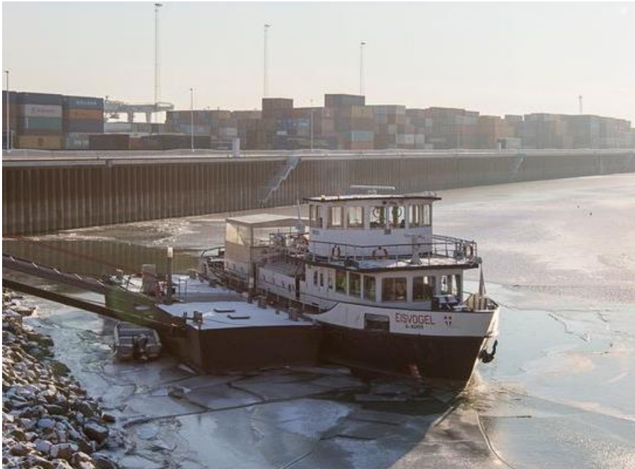
Abbildung 22: Motorschiff Eisvogel im Hafen Freudenau