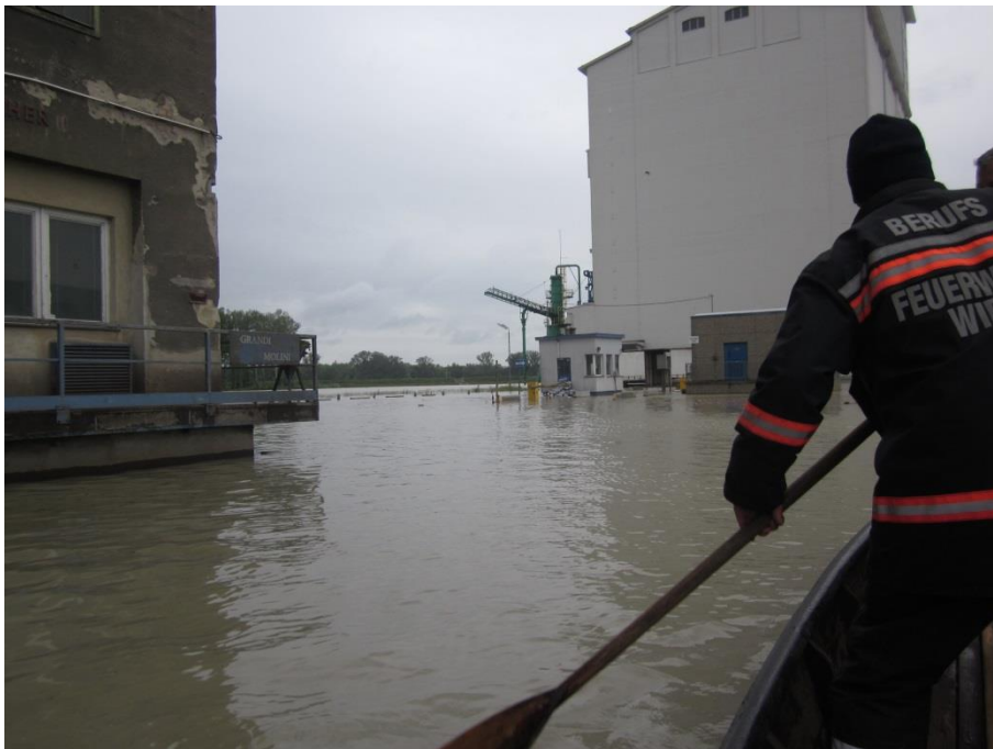
Abbildung 4: Hochwasser im Hafen Albern

3.4.1 In den Jahren 2002 und 2013 kam es zu Hochwasserereignissen im Hafen Albern, bei denen der Wasserstand die Kaikante überschritt. Die Abb. 4 zeigt den überschwemmten Hafen Albern am 4. Juni 2013 im Bereich der Brückenwaage mit dem damaligen Waagenhaus.