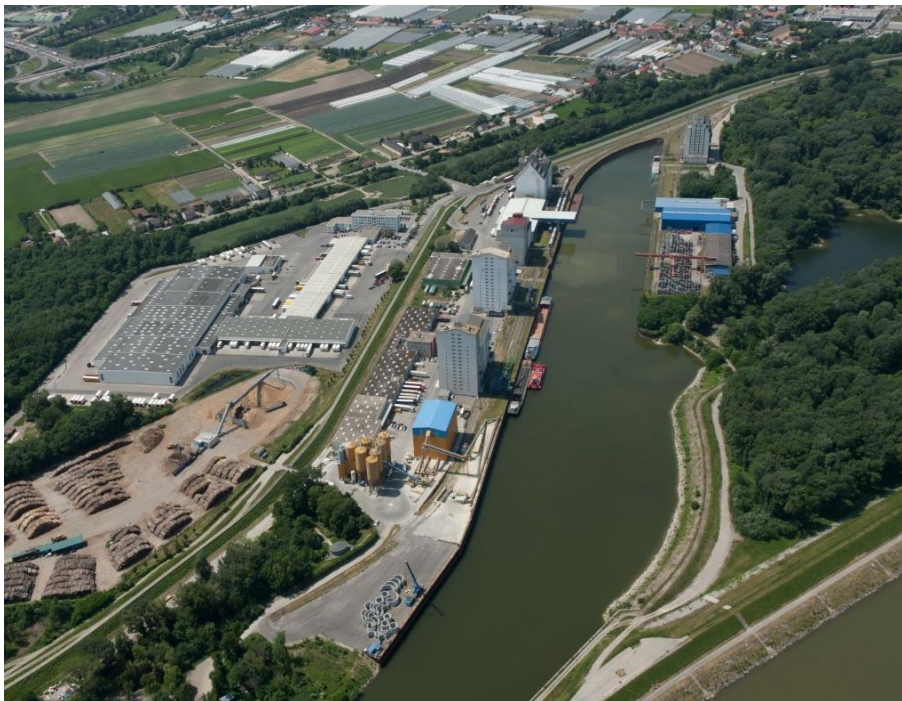
Abbildung 1: Luftbild vom Hafen Albern

3.1.1 Der Hafen Albern (s. Abb. 1) befindet sich im 11. Wiener Gemeindebezirk und liegt an der Donau bei Stromkilometer 1.918,3. Der Hafen Albern umfasst vor dem Hochwasserdamm eine Fläche von rd. 332.000 m 2 . Diese befindet sich im Grundeigentum der Wiener Hafent, GmbH & Co KG. Das Hafenbecken selbst macht davon rd. 95.000 m 2 aus und ist zum Großteil durch Spundwände eingefasst. Es ist landseitig von Straßen, Gleisanlagen und Gebäuden umgeben. Die Straßen tragen die Bezeichnungen 1. Molostraße, Alberner Hafenzufahrtsstraße und 2. Molostraße.