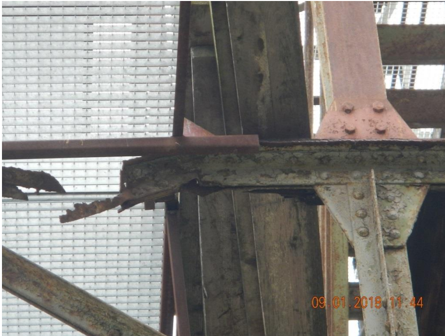
Abbildung 6: Korrodierte Stahlprofilteile an einem Verladeturm