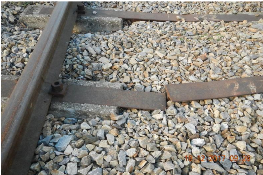
Abbildung 9: Gebrochener Spurhalter

6.5 Die Abb. 9 zeigt beispielhaft einen gebrochenen Spurhalter einer Zweiblockschwelle. Im genannten Gleisbereich (s. Pkt. 6.4) waren mehrere Spurhalter gebrochen. Die gebrochenen Spurhalter befanden sich aber nicht direkt nebeneinander. In so einem Fall hätte sich das Entgleisungsrisiko wegen der dann schlechteren Absicherung der richtigen Spurweite weiter erhöht.