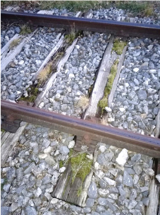
Abbildung 11: Morsche Holzschwellen mit Moos- und Grasbewuchs