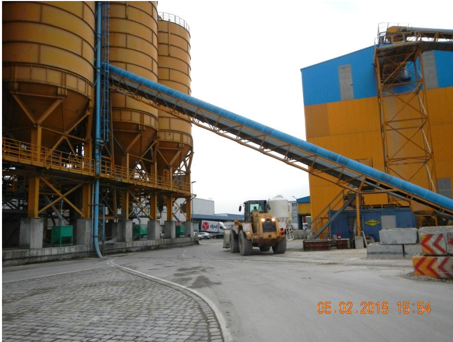
Abbildung 20: Radlader auf der 1. Molostraße

eingesetzt wird, die auf beiden Seiten der 1. Molostraße situiert sind. Privatpersonen müssten daher darauf aufmerksam gemacht werden, dass ihnen derartige Baufahrzeuge entgegenkommen können.