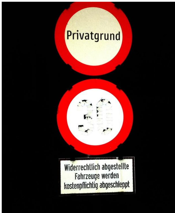
Abbildung 16: Undeutlich gewordene Aufschrift auf einem Verkehrszeichen