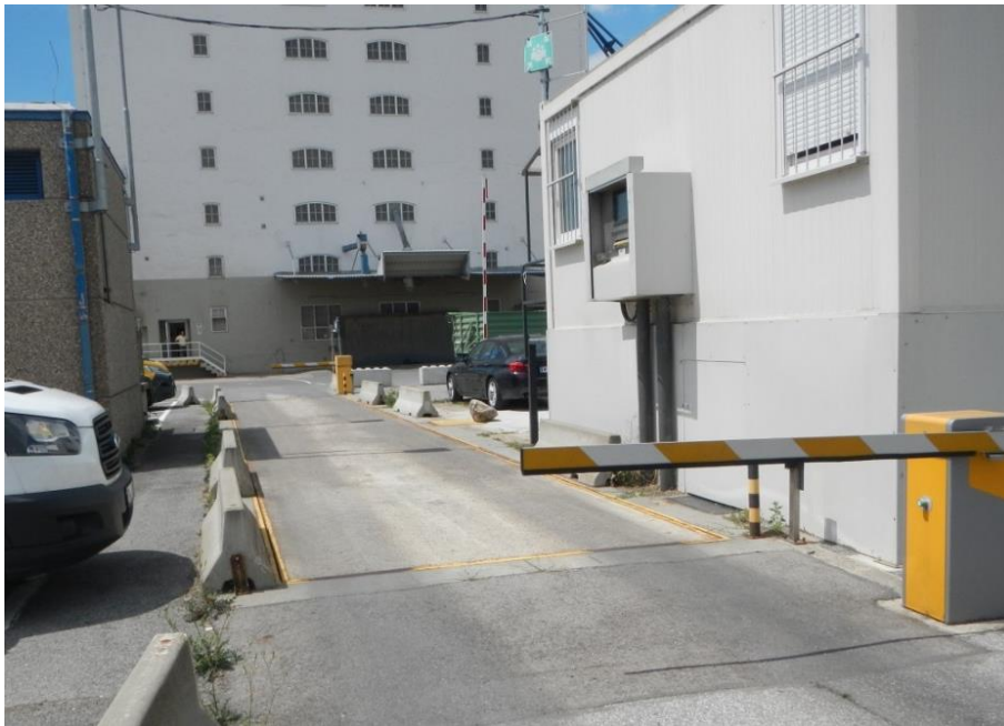
Abbildung 14: Brückenwaage im Hafen Albern

7.1.1 Die Wiener Hafan, GmbH & Co KG verfügt im Hafen Albern über eine Brückenwaage (s. Abb. 14) zum Abwägen von Straßenfahrzeugen. Die Brückenwaage ist nicht öffentlich. Sie kann nur von den im Hafen Albern ansässigen Firmen bzw. in deren Auftrag mit einer Berechtigungskarte zu den vorgesehenen Öffnungszeiten gegen Entrichtung einer Gebühr benützt werden.