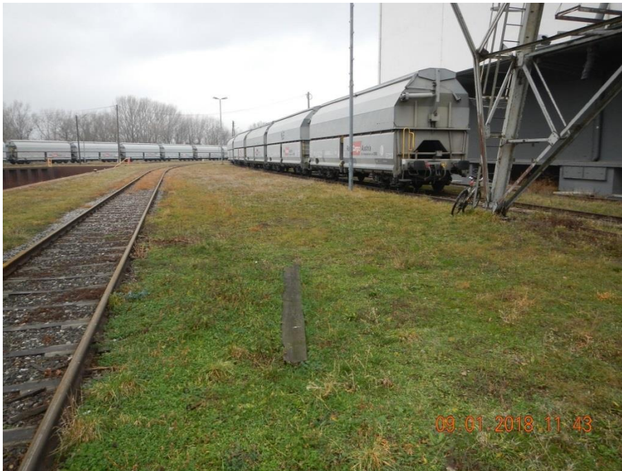
Abbildung 8: Holzpfosten unter demselben Verladeturm

4.2.4 Am Boden unter demselben Verladeturm wurde ein Holzpfosten vergleichbarer Größe und Gestalt vorgefunden (s. Abb. 8). Dieser könnte vom Verladeturm heruntergefallen sein.