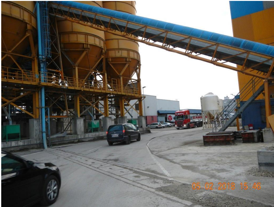
Abbildung 19: Privater Fahrzeugverkehr auf der 1. Molostraße