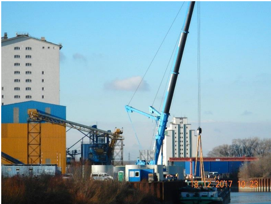
Abbildung 2: Schwergutumschlag mit einem mobilen Kran

3.1.4 Im Bereich des wasserseitigen Umschlags beteiligt sich die Wiener Hafengruppe und Lager Ausbau- und Vermögensverwaltung, GmbH & Co KG beim Schwergutumschlag (s. Abb. 2) aufgrund einer vertraglichen Verpflichtung mit Personal für den Anschlag der Lasten an die Hebemittel eines mobilen Krans gegen Entgelt.