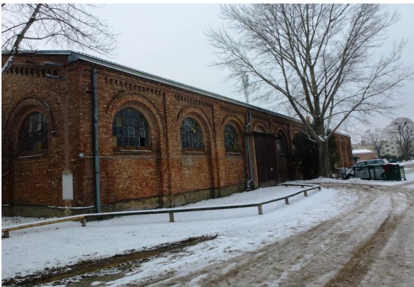
Abbildung 12: Reithalle

4.4.4.2 Die alte Reithalle (s. Abbildung 12), war wie oben erwähnt durch eine einseitig beplankte Holzständerwand (s. Abbildung 13) in zwei Bereiche unterteilt.