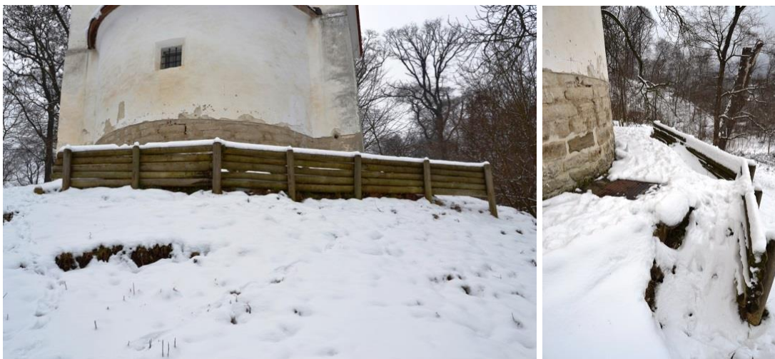
Abbildungen 4 und 5: Abwärts geneigte Holzbrüstung

Darüber hinaus ergaben sich durch die Niveauunterschiede der Betonsteinpflasterung erhebliche Stolpergefahren.