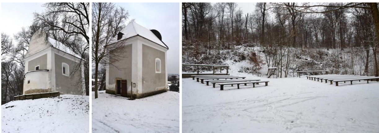
Abbildungen 1, 2 und 3: Ansichten der Nikolaikapelle samt Besucherinnen- bzw. Besucherbereich

Der Stadtrechnungshof Wien führte im Dezember 2018 im Beisein der Magistratsabteilung 49 eine Vorortbesichtigung der Nikolaikapelle durch. Die Nikolaikapelle ist, wie bereits erwähnt, über das sogenannte Nikolaitor des Lainzer Tiergartens im 13. Wiener Gemeindebezirk zu erreichen und liegt auf einer Anhöhe, unweit von diesem entfernt. Die sich darstellende Bauart der Kapelle, mit ihrem rechteckigen Hauptraum und ihrer eingezogenen Halbkreiswölbung, war Mitte des 13. Jahrhunderts weit verbreitet. Die nachfolgenden Abbildungen veranschaulichen den o.a. rechteckigen Grundriss in Verbindung mit der Halbkreiswölbung und zeigen die im Jahr 1735 eingebauten Fenster (s. Abbildungen 1 und 2). Ferner wird der im Freien befindliche Besucherinnen- bzw. Besucherbereich für die jährlich stattfindende Feier zu Ehren des Hl. Eustachius in den nachfolgenden Abbildungen dargestellt (s. Abbildung 3).