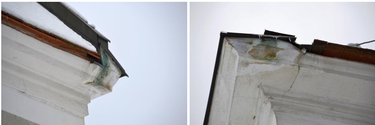
Abbildungen 6 und 7: Schäden am Mauerwerk aufgrund mangelhaft hergestellter Attikaverblechung

Der Stadtrechnungshof Wien stellte im Zuge der Prüfung fest, dass die Attikaverblechung an beiden Enden der freien Giebelmauer mangelhaft hergestellt worden war. Dies zeigte sich deutlich an den bestehenden Abfärbungen am Mauerwerk, welche durch an der Verblechung abfließendes Wasser hervorgerufen worden waren. Des Weiteren zeigte sich, dass das Mauerwerk unterhalb der Verblechung durchfeuchtet war und bereits Putzschäden verursachte (s. Abbildungen 6 und 7). Der Stadtrechnungshof Wien merkt in Bezug auf die o.a. Abfärbungen am Mauerwerk an, dass diese bereits im Jahr 2008 bestanden, wie ein älteres Foto aus diesem Zeitraum belegte.