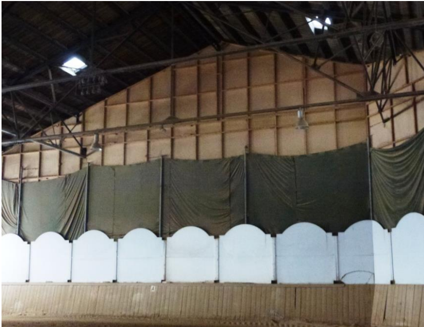
Abbildung 13: Holzständerwand als Trennung innerhalb der alten Reithalle