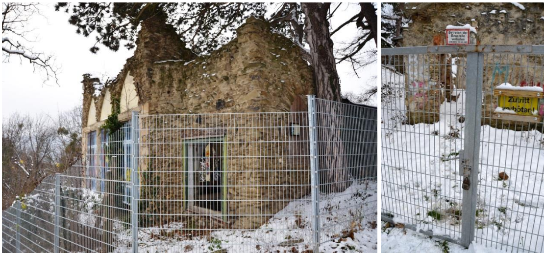
Abbildungen 10 und 11: Metallzaun samt Föhre und Schließmechanismus des Gartentores