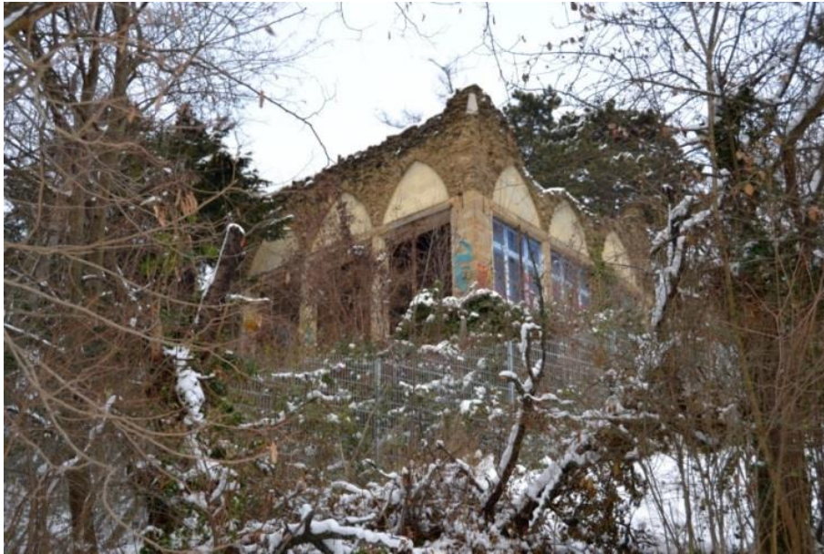
Abbildung 9: Ruinenvilla

Bei der Begehung durch den Stadtrechnungshof Wien im Dezember 2018 zeigte sich die Ruinenvilla in einem sehr baufälligen bzw. sogar einsturzgefährdenden Zustand (s. Abbildungen 9 bis 11).