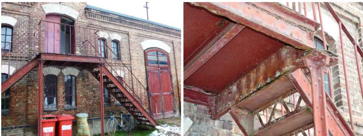
Abbildungen 15 und 16: Stark beschädigte Metalltreppe an der Außenmauer des Stallgebäudes

An der Außenseite des Stallgebäudes war eine Metalltreppe montiert, welche zu Räumlichkeiten im ersten Stockwerk und in den Dachboden führte. Diese Treppe wies starke Korrosionsschäden auf (s. Abbildungen 15 und 16). Teilweise waren konstruktive Verbindungen und Absturzsicherungen schadhaft. Nach Ansicht des Stadtrechnungshofes Wien befand sich diese Metalltreppe in einem sicherheitstechnisch bedenklichen Zustand und es wäre diese umgehend von einem Zivilingenieurbüro auf ihre Gebrauchstauglichkeit bzw. Standsicherheit hin zu überprüfen. Bis dahin wäre die Zugangstreppe jedenfalls zu sperren.