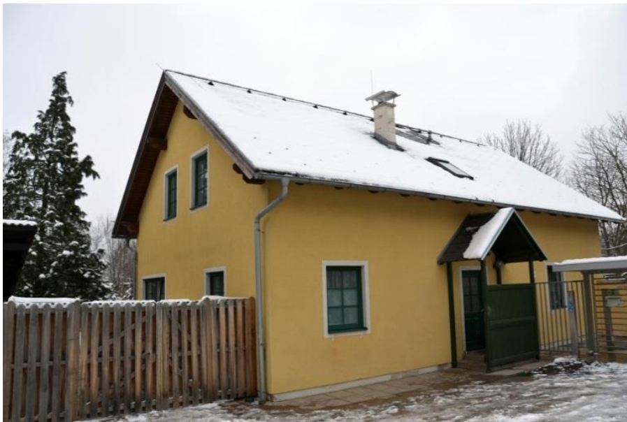
Abbildung 8: Ansicht Forsthaus Pulverstampftor